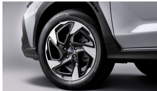
Алюминий қорытпасынан жасалған 18 дюймдік дөңгелектер

1. Көрсетілген бағалар максималды алып-сату бағалары болып табылады және жинақтамаларда көрсетілген опциялар алдын ала хабарланбастан өзгертіле алады, себебі бағалар мен жинақтамалар туралы мәліметтер ақпараттық мақсатта ғана берілген.