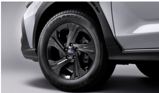
17 дюймдік дөңгелектер